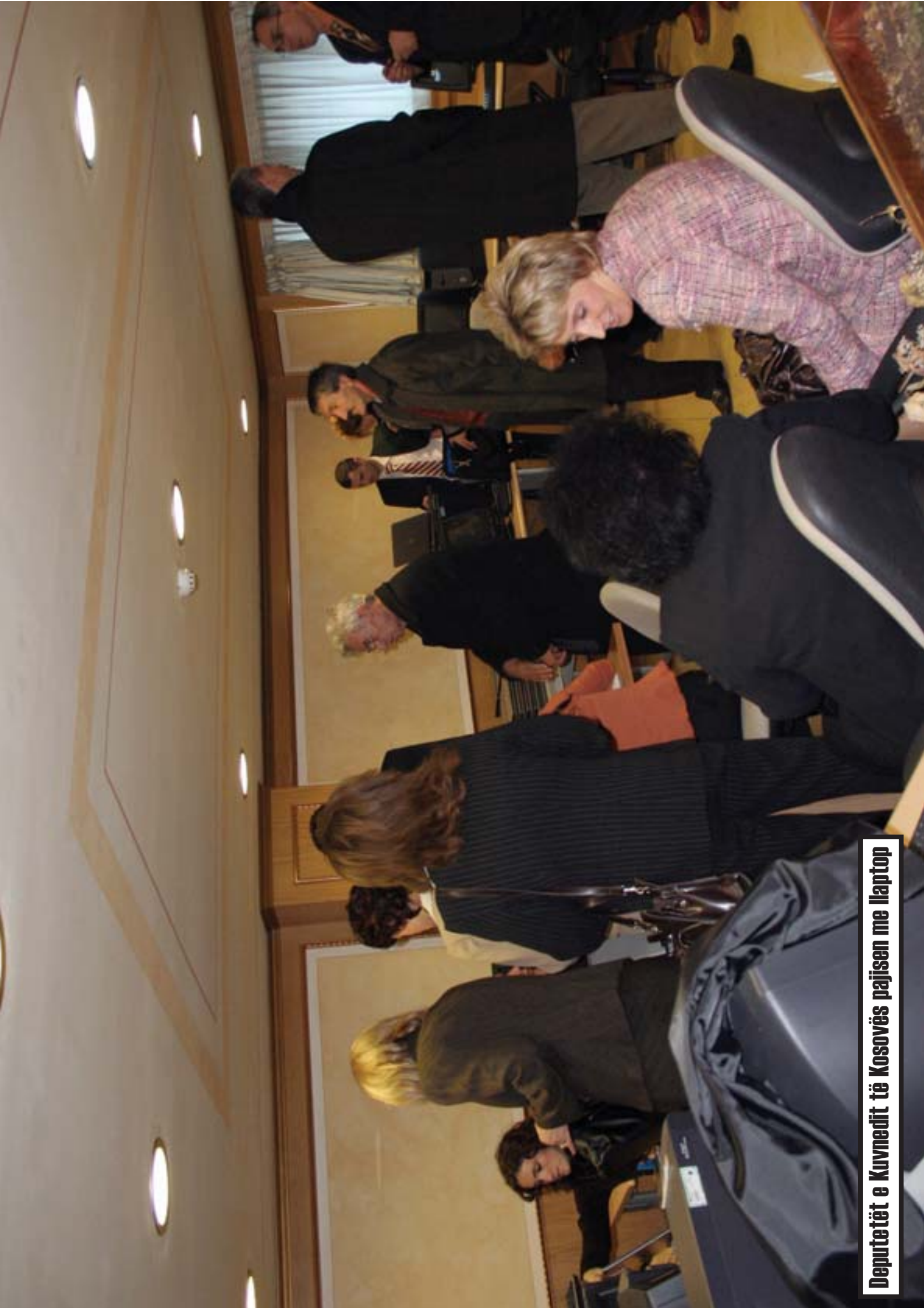
Deputetët e Kuvndit të Kosovës pajisen me laptop